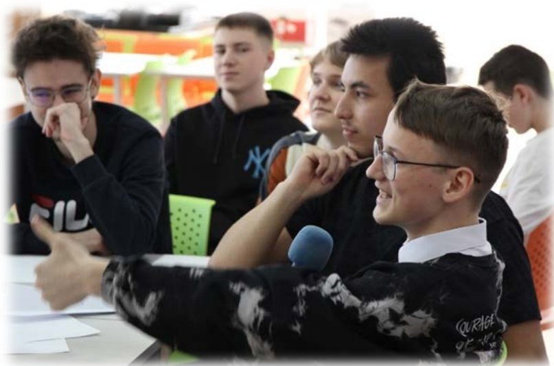
Квиз в 10-11-х классах «ФинЗОЖ»