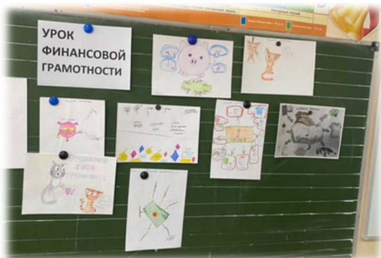
Урок в 4 классе «Что такое деньги и откуда они взялись»