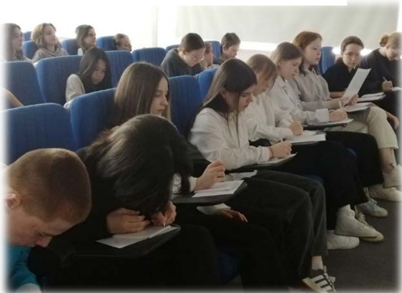
Квиз в 8-х классах «ФинЗОЖ»