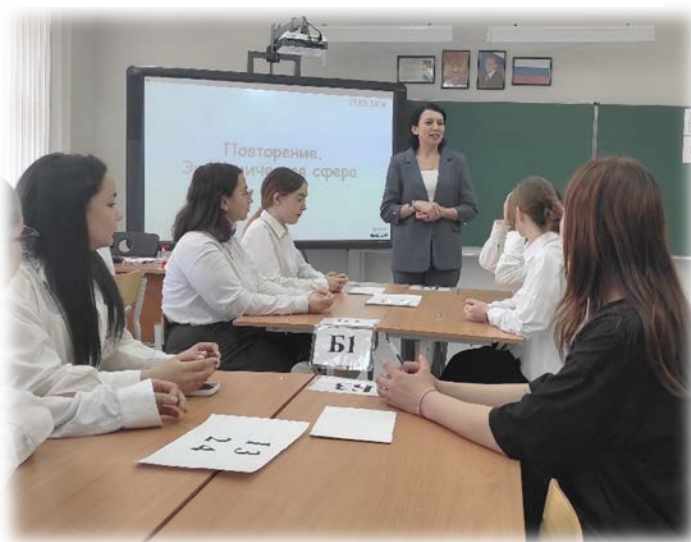
Открытый урок в 10 «Б» классе «Экономическая сфера. Предпринимательство»