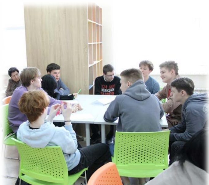
Квиз в 10-11-х классах «ФинЗОЖ»