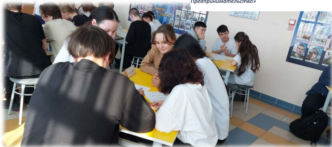
Квиз в 10-11-х классах «ФинЗОЖ»