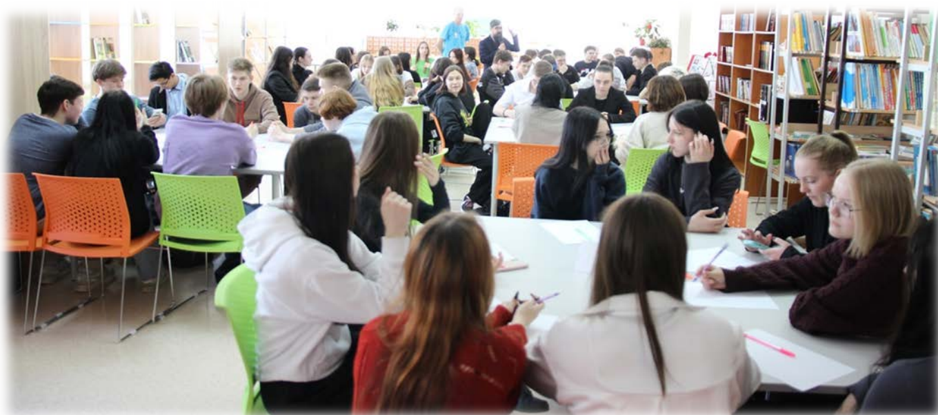
Квиз в 10-11-х классах «ФинЗОЖ»