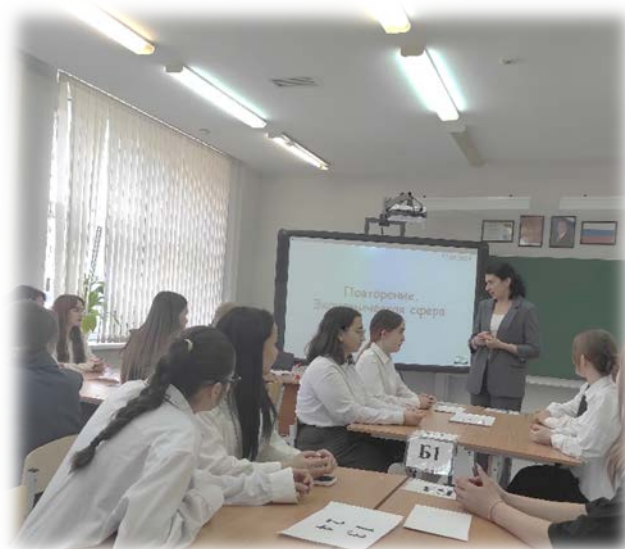
Открытый урок в 10 «Б» классе «Экономическая сфера. Предпринимательство»